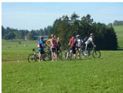
Ecrin vert 2009, Tramelan

Record de participation pour le Raid Nature Ecrin Vert 2009 qui s'est tenu cette année autour de la commune de Tramelan dans le Jura bernois. Cette course de VTT réservée aux lycéens et alternativement organisée en Suisse et en France a attiré 1167 participants venus des quatre cantons d' arc jurassien.ch et de Franche-Comté.